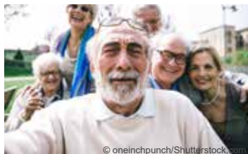
Altern mit Zukunft *

Seniorinnen- und Seniorengesundheitsprogramm für ab 70-Jährige (zweiwöchiger Aufenthalt)