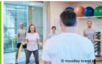
Kraftvoll und Fit *