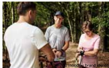
Ausdauernd und Aktiv * (ehemaliges Programm „HerzKreislaufgesundheits“)