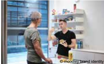
Gesunde Ernährung *

Seniorinnen- und Seniorengesundheitsprogramme für 60- bis 69-Jährige in Pension oder Ruhegenussbezieherinnen und -bezieher (zweiwöchiger Aufenthalt)