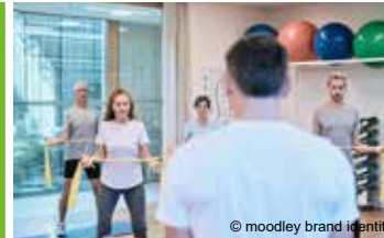
Kraftvoll und Fit *