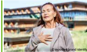
Mentale Fitness *

Seniorinnen- und Seniorengesundheitsprogramm für ab 70-Jährige (zweiwöchiger Aufenthalt)