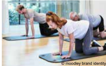
Gesunder Rücken *