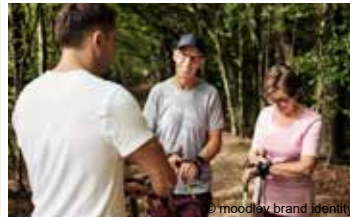
Ausdauernd und Aktiv * (ehemaliges Programm „Herzkreislaufgesundheits“)