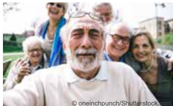
Altern mit Zukunft *

Seniorinnen- und Seniorengesundheitsprogramm für ab 70-Jährige (zweiwöchiger Aufenthalt)