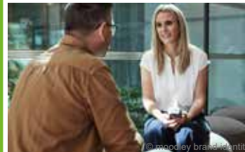
Rauchfrei in 20 Tagen

Aufenthalte zur Nikotinentwöhnung (20-tägiger Aufenthalt)