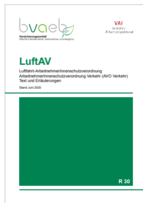
Luftfahrt-ArbeitnehmerInnenschutzVO AVO Verkehr – Text und Erläuterungen