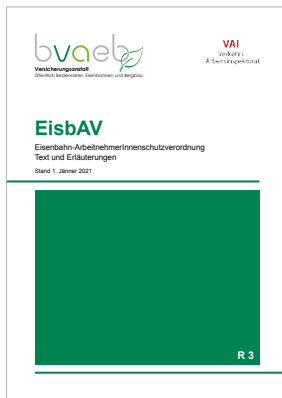
Eisenbahn-ArbeitnehmerInnen- schutzverordnung (EisbAV) – Text und Erläuterungen