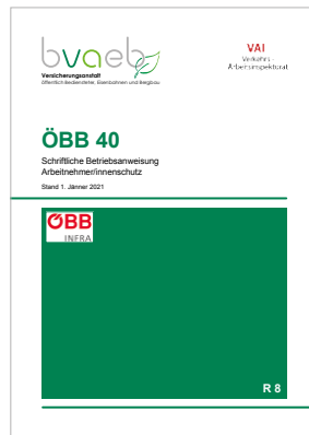
Schriftliche Betriebsanweisung Arbeitnehmer/innenschutz bei den Österreichischen Bundesbahnen (ÖBB 40)