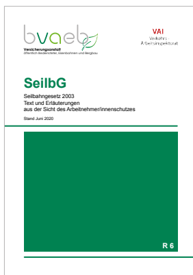
Seilbahngesetz (SeilbG) – Text und Erläuterungen aus der Sicht des Arbeitnehmer/innenschutzes