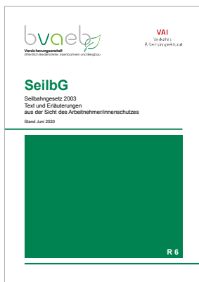
Seilbahngesetz (SeilbG) – Text und Erläuterungen aus der Sicht des Arbeitnehmer/innenschutzes