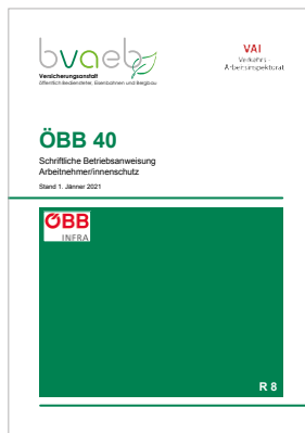
Schriftliche Betriebsanweisung Arbeitnehmer/innenschutz bei den Österreichischen Bundesbahnen (ÖBB 40)