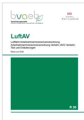
Luftfahrt-ArbeitnehmerInnenschutzVO AVO Verkehr – Text und Erläuterungen