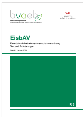
Eisenbahn-ArbeitnehmerInnen- schutzverordnung (EisbAV) – Text und Erläuterungen