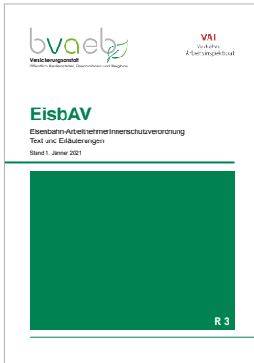
Eisenbahn-ArbeitnehmerInnenschutzverordnung (EisbAV) – Text und Erläuterungen