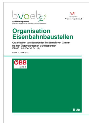
Organisation von Bauarbeiten im Bereich von Gleisen bei den Österreichischen Bundesbahnen DB 601.02 (DA 30.04.15)