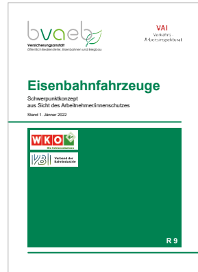
Schwerpunktkonzept über die wichtigsten Arbeitnehmer/innenschutz- bestimmungen für Eisenbahnfahrzeuge