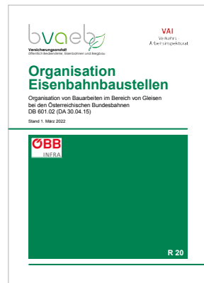
Organisation von Bauarbeiten im Bereich von Gleisen bei den Österreichischen Bundesbahnen DB 601.02 (DA 30.04.15)