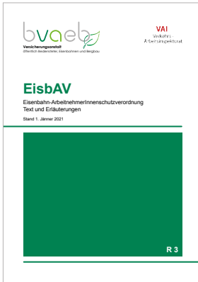
Eisenbahn-ArbeitnehmerInnenschutzverordnung (EisbAV) – Text und Erläuterungen