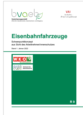
Schwerpunktkonzept über die wichtigsten Arbeitnehmer/innenschutz- bestimmungen für Eisenbahnfahrzeuge