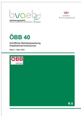
Schriftliche Betriebsanweisung Arbeitnehmer/innenschutz bei den Österreichischen Bundesbahnen (ÖBB 40)